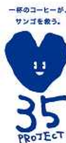
35プロジェクトロゴとイメージ